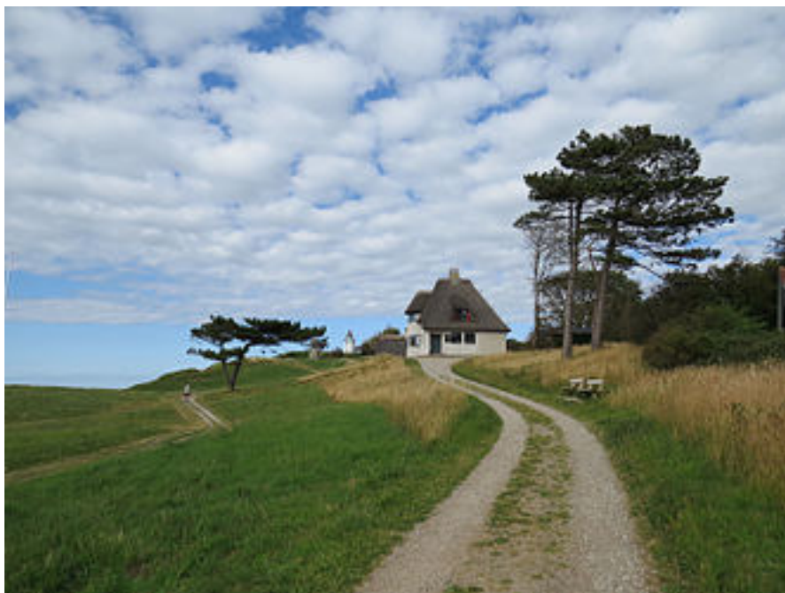
Knud Rasmussens Hus er en del af Industrimuseet Frederiks Værk.

Til huset hører et over 25.000 m 2 stort naturområde lige ud til Kattegat og i umiddelbar tilknytning til Spodsbjerg fyr.